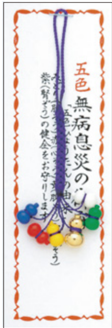
28 五色無病息災守 初穂料 700 円