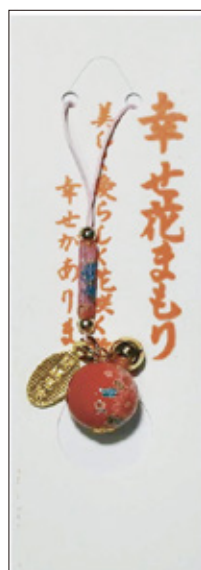
34 幸せ花守り 初穂料 700 円