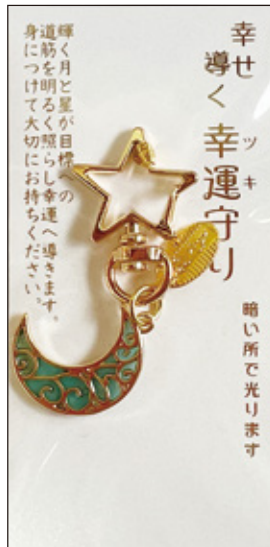
29 幸せ導く幸運守 初穂料 700 円