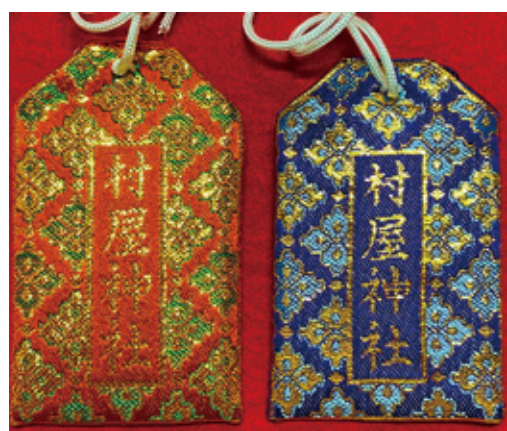
35A 村屋神社刺繍入り 御守り袋 (赤) 初穂料 700 円