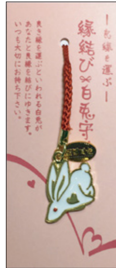
27 縁結び白兔守 初穂料 700 円