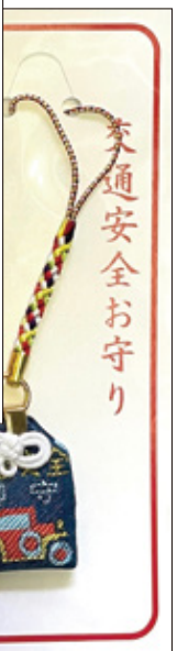
36B 交通安全お守り (紺) 初穂料 各 700 円