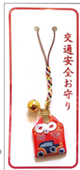
36A 交通安全お守り (赤) 初穂料 各 700 円