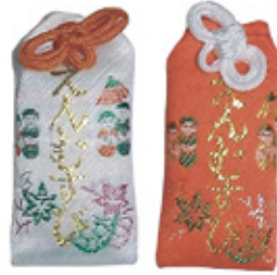
26 縁結びお守袋 白 / 赤 初穂料 500 円