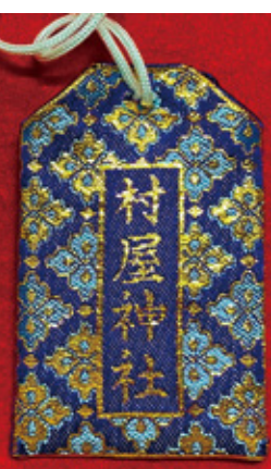
35B 村屋神社刺繍入り 御守り袋 (青) 初穂料 700 円