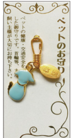
32 ペットのお守 (犬) 初穂料 1,000 円