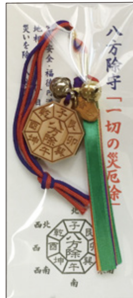
30 八方除け守 初穂料 1,000 円 取り寄せ中