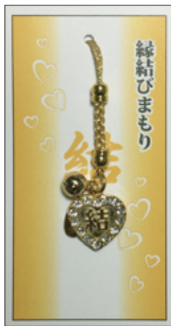
29 金属ハート縁結び守 初穂料 700 円 取り寄せ中