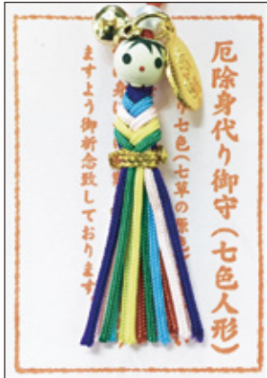
27 厄除け身代り守 初穂料 700 円 取り寄せ中