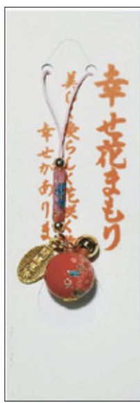
36 幸せ花守り 初穂料 700 円