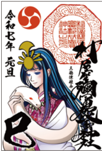
13 巳様と三穂津姫様の御朱印 初穂料 300 円