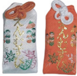
28 縁結びお守袋 白/赤 初穂料 500 円