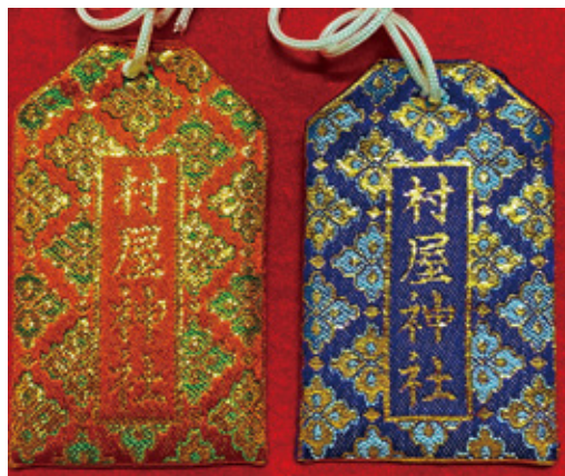
37 村屋神社刺繍入り 御守り袋 初穂料 700 円