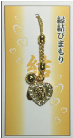
31 金属ハート縁結び守 初穂料 700 円