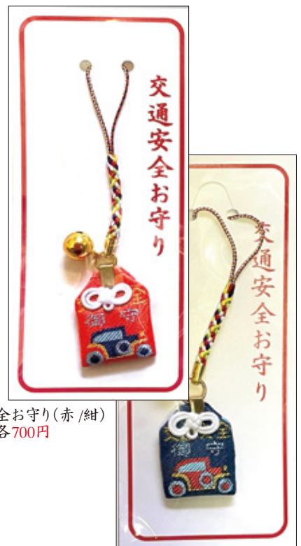
38 交通安全お守り (赤/紺) 初穂料各 700 円