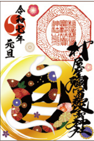
14 巳様の御朱印 初穂料 300 円