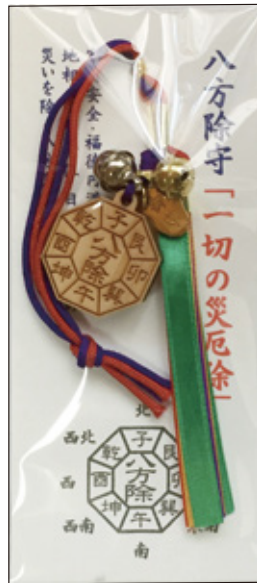
32 八方除け守 初穂料 1,000 円