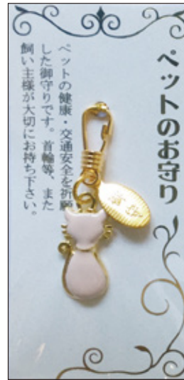
33 ペットのお守り (猫) 初穂料 1,000 円