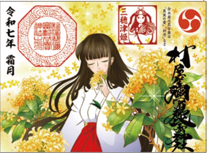
15 金木犀と巫女の見開き御朱印 初穂料 600 円