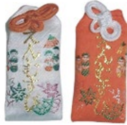
27 縁結びお守袋 白 / 赤 初穂料 500 円