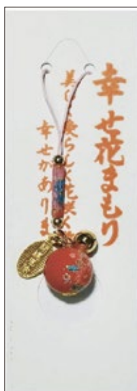
35 幸せ花守り 初穂料 700 円