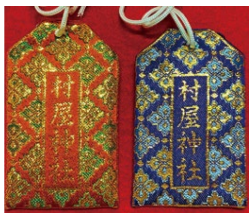
36 村屋神社刺繍入り 御守り袋 初穂料 700 円