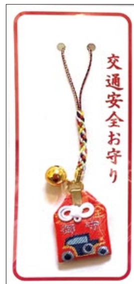
37 交通安全お守り (赤 / 紺) 初穂料各 700 円