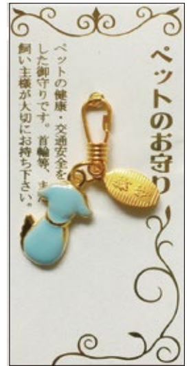
33 ペットのお守 (犬) 初穂料 1,000 円