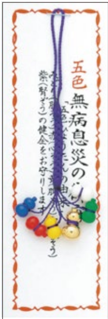
29 五色無病息災守 初穂料 700 円