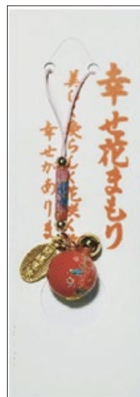
35 幸せ花守り 初穂料 700 円