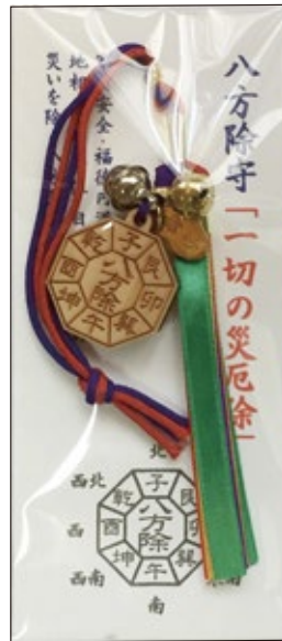
31 八方除け守 初穂料 1,000 円