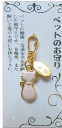
32 ペットのお守 (猫) 初穂料 1,000 円