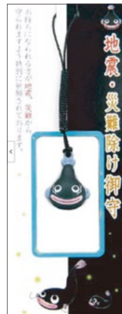
36 地震・災難除け鈴守 初穂料 1,000 円