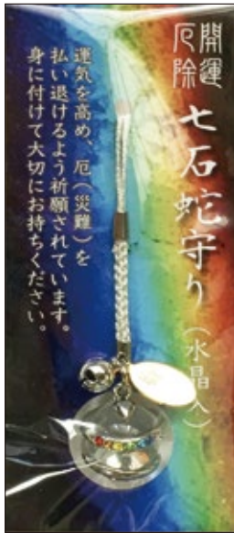
30 七石蛇守り 初穂料 1,000 円