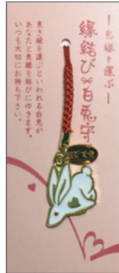
28 縁結び白兔守 初穂料 700 円