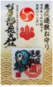
13 貼ってはがせる スマホ用お守り 初穂料500円